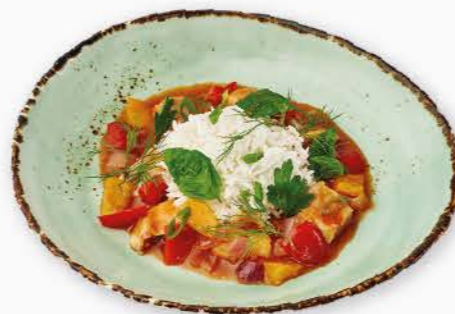
рис 120 г / 145 ккал греча 120 г / 121 ккал картофельное пюре 120 г / 170 ккал