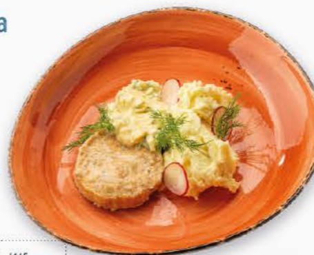
рис 120 г / 145 ккал греча 120 г / 121 ккал картофельное пюре 120 г / 170 ккал